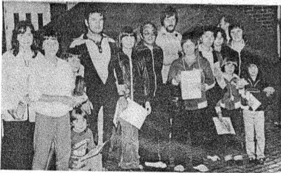
Een mooi brevet na de Kalfortse wandeling. (al)

Voor de tweede maal werd bij gelegenheid van Kalfort kermis een wandeltocht ingericht. De Puurse wandelclub Ibis fungeerde als organisator. Het succes was ondanks de minder gunstige weersomstandigheden vrijdagavond — het regende pijpenstelen toen de deelnemers van start moesten gaan — volledig. Liefst 300 deelnemers zetten aan in deze IBIS organisatie. Gemeten met het succes van de eerste organisatie vorig jaar, mag men hier wel van een flinke